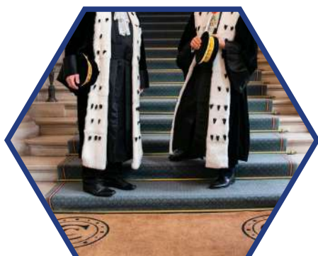
Magistrat de la Cour des comptes