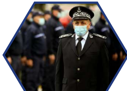
Directeur d'un centre pénitentiaire