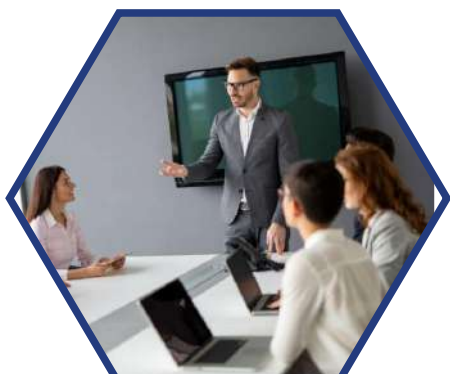
Directeur des ressources humaines d'une commune de + de 40 000 habitants