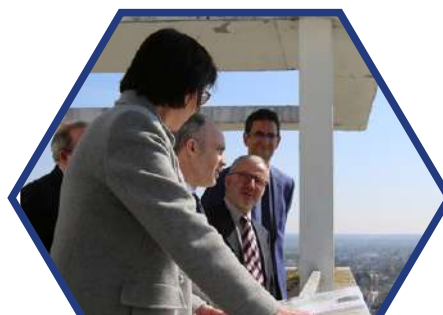
Directrice de l'aménagement urbain et de l'environnement d'une commune de + de 80 000 habitants