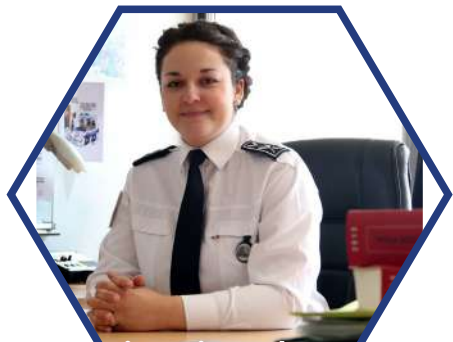
Commissaire de police