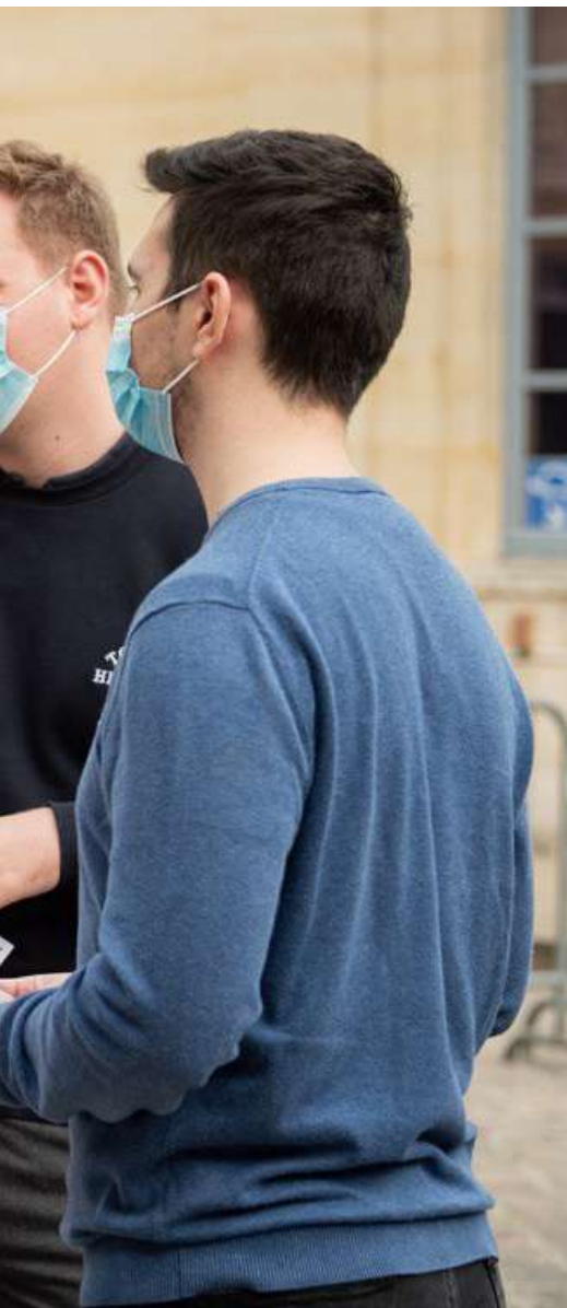
Amélie de Montchalin Ministre de la transformation et de la fonction publiques

La crise sanitaire éprouve durement notre jeunesse. Elle a interrompu ces derniers mois pour beaucoup d'entre eux des projets, remis en cause des ambitions. Mais, au-delà, elle est le révélateur d'un malaise beaucoup plus profond, qui s'aggrave : une partie d'entre elle ne croit plus en ses chances au sein de la République.